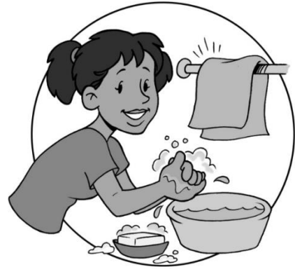
Nettoyage des mains au savon

Cette fiche technique relate l'histoire du savon, explique ce qu'est le savon, comment il est fabriqué, et décrit deux procédés de fabrication de savon. Le savon est un élément nécessaire à une bonne hygiène. Apprendre aux gens comment faire du savon peut être un bon ajout à tout projet d'eau, d'hygiène et d'assainissement (WASH). Les ingrédients pour fabriquer du savon peuvent se trouver presque partout et le procédé est simple. Faire leur propre savon permet aux personnes de fabriquer le savon qui répond à leurs besoins et préférences, et peut aussi être une opportunité commerciale pour les entrepreneurs locaux.